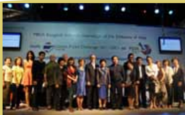
Y W C A