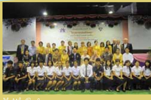
Y W C A