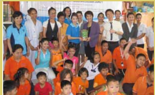
Y W C A