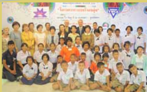
Y W C A