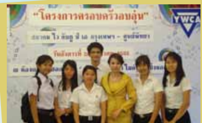
Y W C A