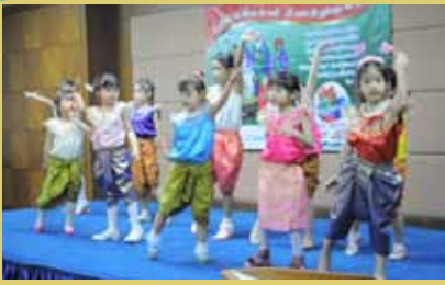
Y W C A