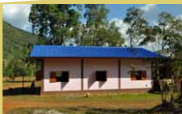
Y W C A