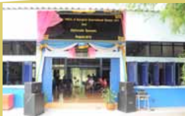
Y W C A