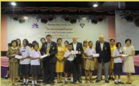
Y W C A

A new Board of Director appointment of YWCA of Bangkok-Pattaya Center was made on June 29, 2012 at Diana Garden Resort Hotel.