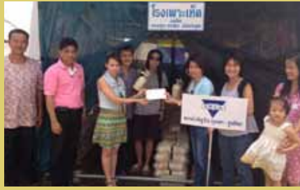
Y W C A