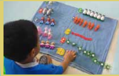
Y W C A