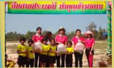
Y W C A