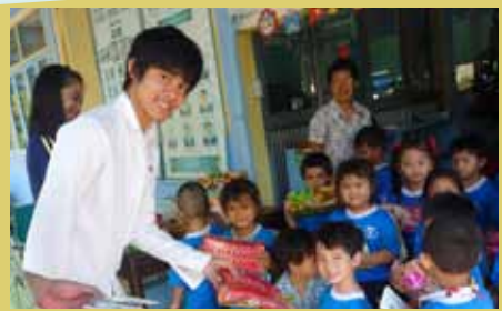
Y W C A