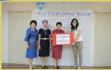
Y W C A