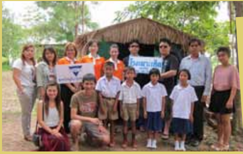
Y W C A