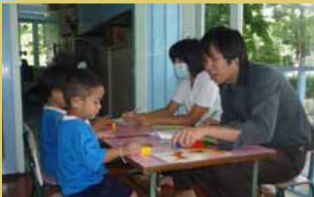
Y W C A