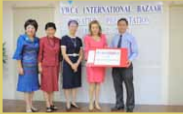
Y W C A