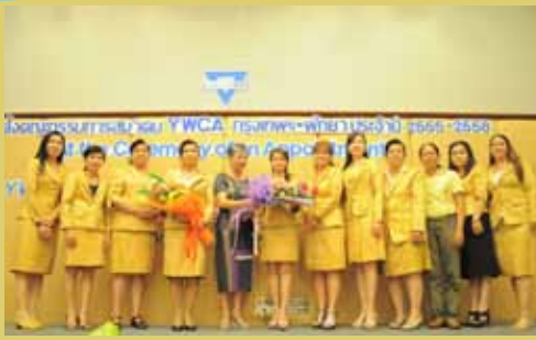
Y W C A