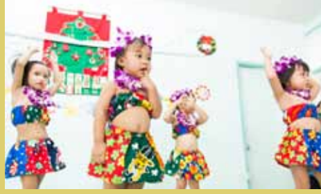
Y W C A