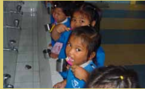
Y W C A