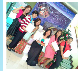
คริสตมาส Christmas Party