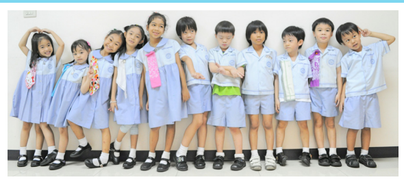
นักเรียนจบหลักสูตร Graduation's Day