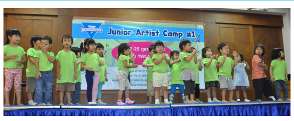
ค่ายเด็กปฐมวัย Day Camp