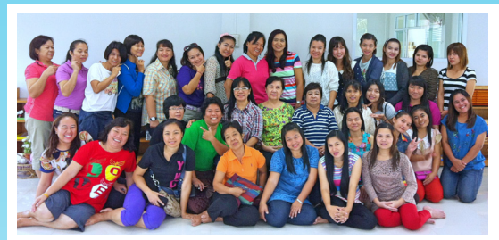
รีทริตพนักงานฝ่ายการศึกษา Retreat for Education Staff