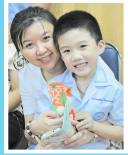
กิจกรรมวันแม่ Mother's Day Activities